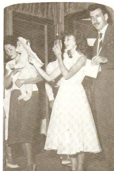
Programa de auditório na rádio Clube de Goiânia