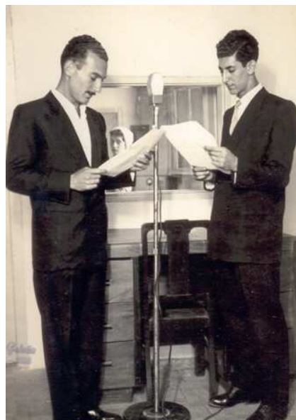
Locutores no estúdio da rádio Xavantes na década de 1940