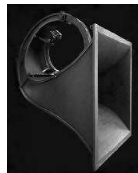
Alto-falante coaxial utilizado na década de 1920 e início de 1930, idealizado por Herman J. Fanger

Ao depararmos com esta informação buscamos conhecer melhor do que se tratavam estes sistemas de alto-falantes. Logo tomamos conhecimento que o sistema de alto-falantes era um sistema bem simplificado de comunicação composto por um microfone, um aparelho amplificador e os alto-falantes, e todos os aparelhos interligados com fios. Os alto-falantes são semelhantes