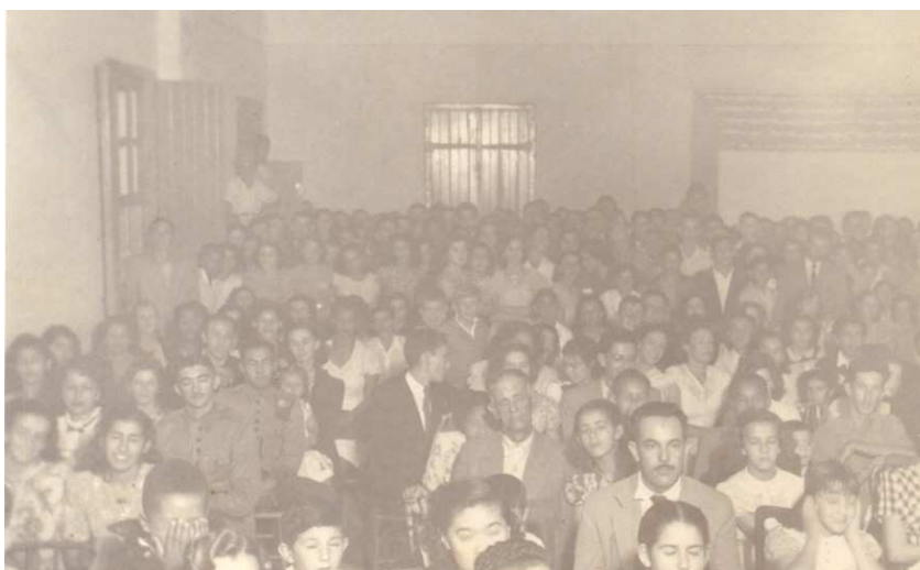
Auditório da rádio Xavantes de Ipameri

Adolvando nos contou que participava dos programas de auditório daquela emissora e, segundo ele, tinha “um palco auditório com capacidade de mais ou menos 400 pessoas” (ALARCÃO, 2007).