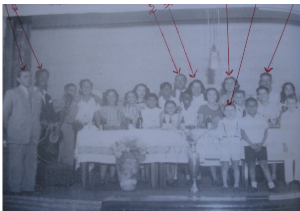
Programa infantil no palco da rádio Carajá